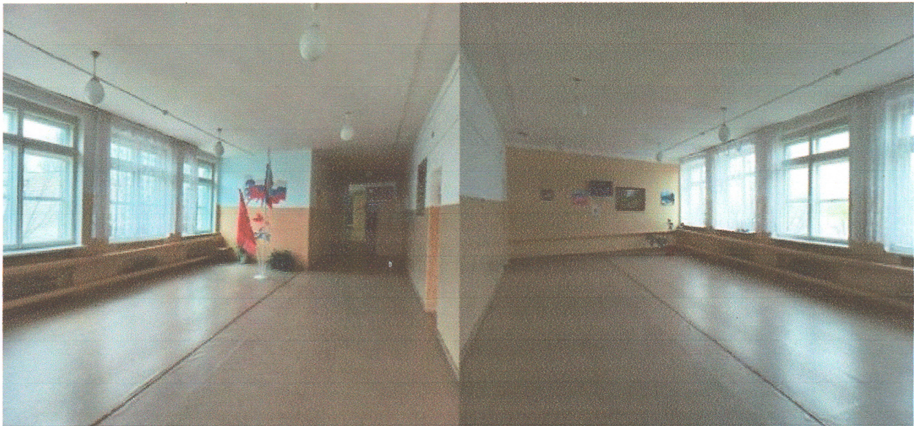
состояние объекта «До»