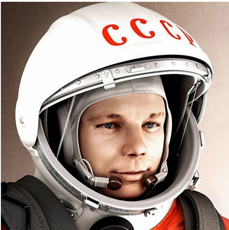
Ю.А. Гагарин (1934 – 1968) 12 апреля 1961 – первый полет человека в космос